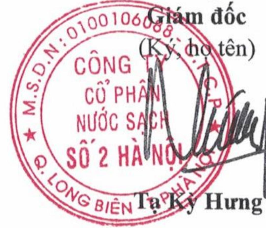
Tạ Kỳ Hưng